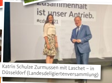
Katrin Schulze Zurmussen mit Laschet – in Düsseldorf (Landesdeligiertenversammlung)