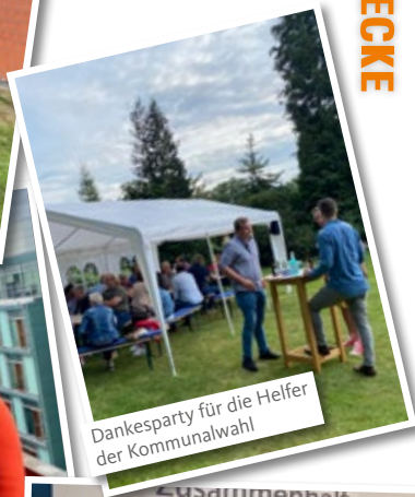
Dankesparty für die Helfer der Kommunalwahl