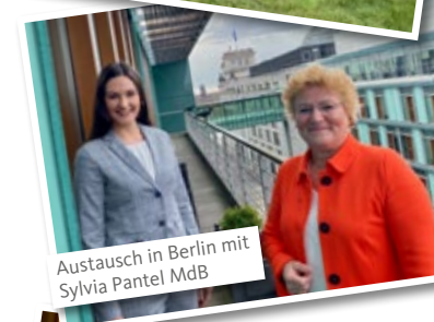
Austausch in Berlin mit Sylvia Pantel MdB