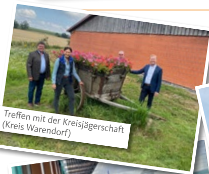
Treffen mit der Kreisjägerschaft (Kreis Warendorf)